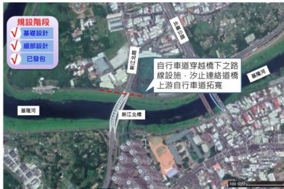
圖 1-1 工程計畫位置圖

本案工程位於汐止區基隆河右岸新江北橋，施作自行車道穿越橋下之路線設施，汐止連絡道橋上游自行車道拓寬。工程計畫位置圖詳圖 1-1。