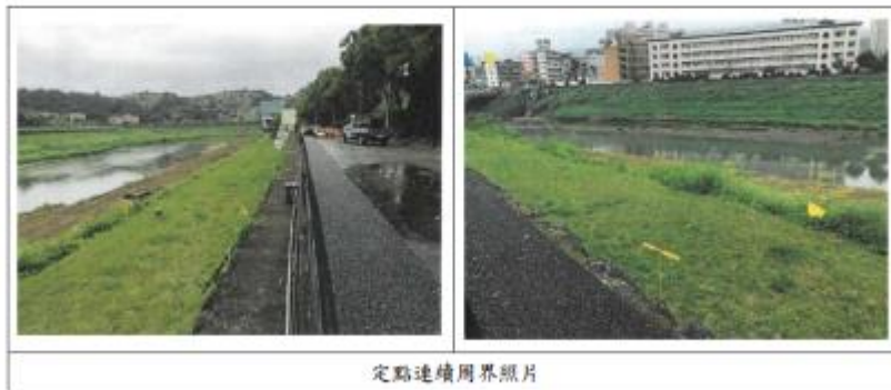
定點連續周界照片