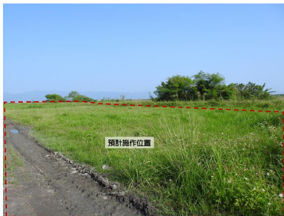
圖 3 工程預計施作位置