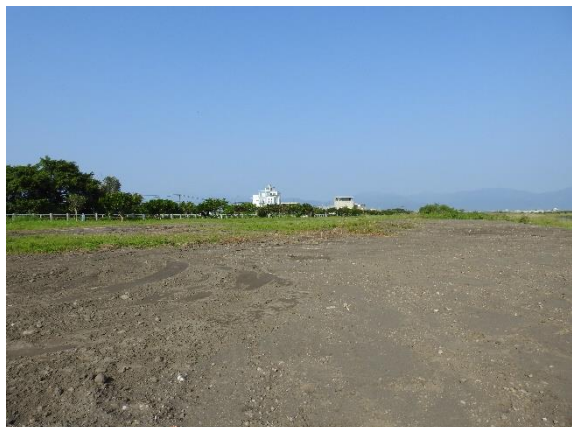
圖 2 大面積裸露地

叢」，但因常有工程土方堆置及擾動，導致現地有大面積裸露地(圖 2)，以及布滿外來種草本植栽之草地和少許水黃皮植栽，形成「稀疏樹木的草坪綠地」。