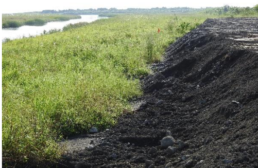
堆棄土方形成高灘地