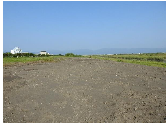
工程預計施作位置範圍