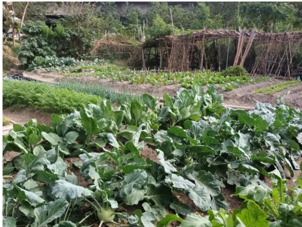
工區自行車道旁菜園

工區自行車道周遭環境包含菜園、次生林、堤防草坡及排水溝，現勘期間發現樹鵲於次生林內活動，本次現勘期間未發現兩棲爬蟲類，但周遭菜園及排水溝環境可能為兩棲爬蟲類出沒環境。另本案工區經查路殺社資料顯示，工區有 柴棺龜 及 草花蛇 路殺紀錄，本案工程施作期間須迴避周遭環境及避免路殺事件發生。