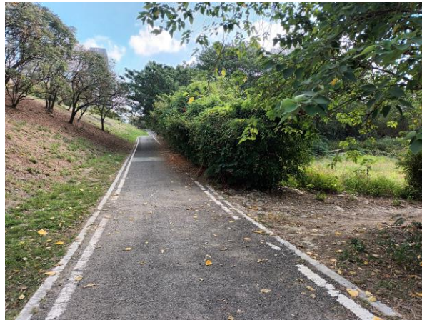
工區自行車道旁堤防草坡及次生林