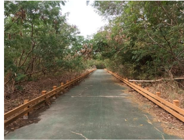
工區自行車道旁次生林