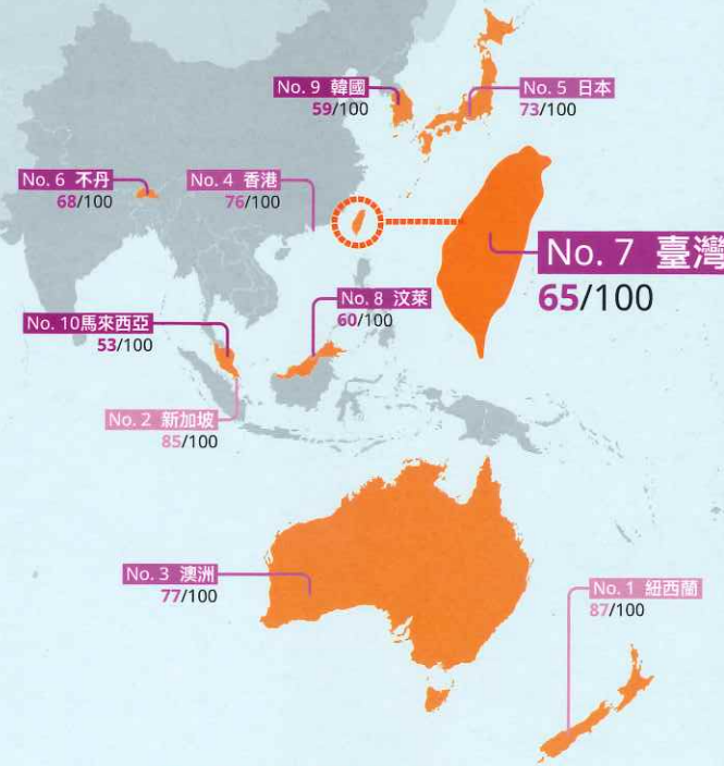
亞太區國家排名前十位置圖