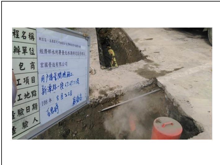
施工照片：陰井埋設