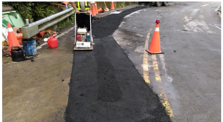
施工照片：瀝青混凝土鋪面