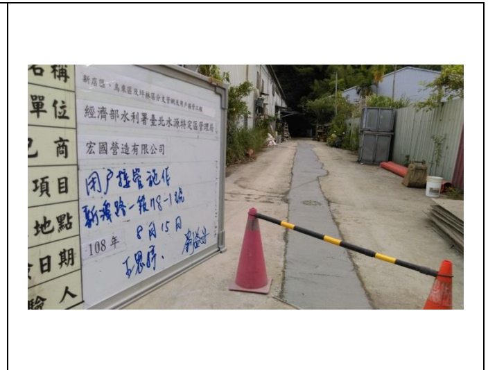
施工照片：RC路面復舊