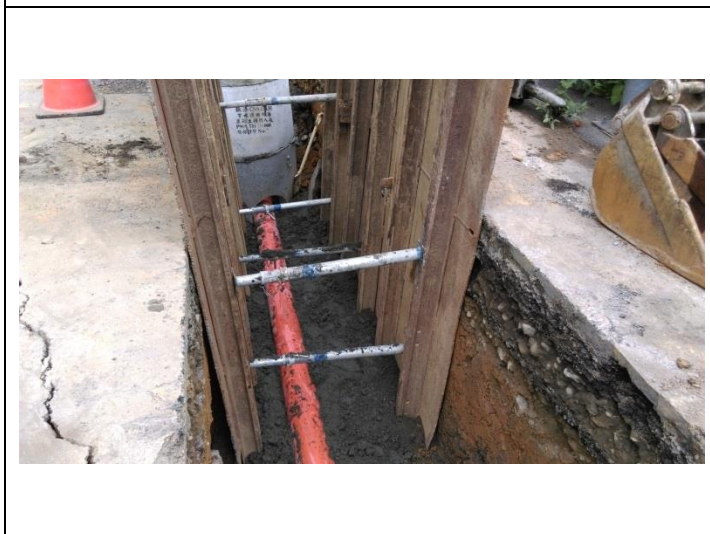
施工照片：管溝擋土支撐