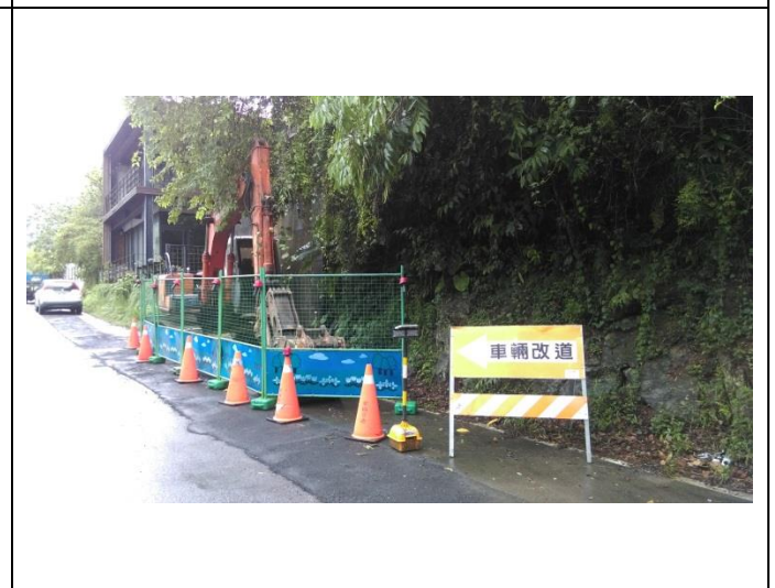
施工照片：安全圍籬圍設