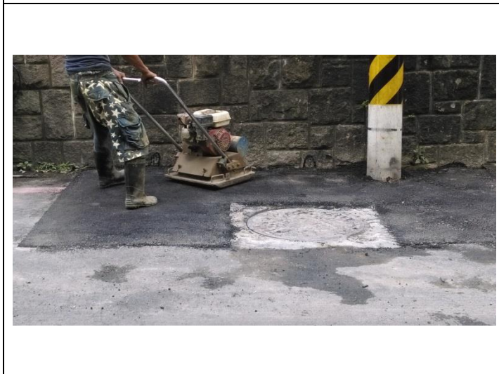
施工照片：瀝青面層鋪築