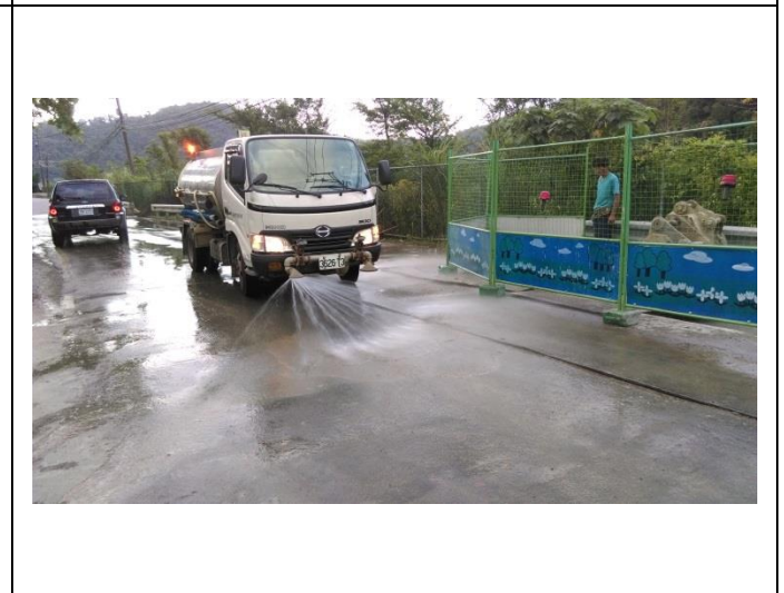
施工照片：工區防塵灑水