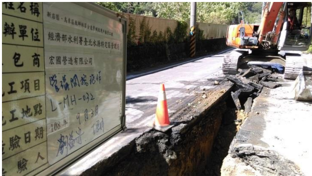
施工照片：管溝開挖