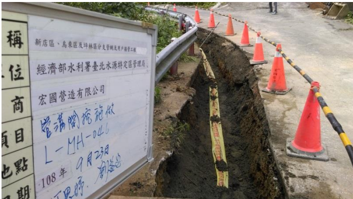
施工照片：管線警示帶