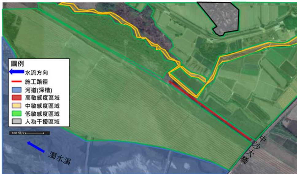
圖 4-119 中沙大橋至自強大橋段簡易設施工程生態關注圖

本工程周圍農地、防風林地、草生地及裸地劃設為低度敏感區，小支流通過之區域皆劃設為中度敏感區，此部分區域於施工時期應盡量迴避，生態關注圖如圖 4-119 所示。