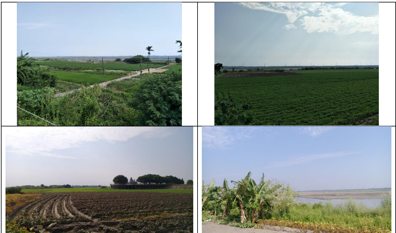
圖 4-128 濁水溪下山腳堤段(斷面 15~21)整建工程現況照

於 109 年 9 月 7 日現場勘查，堤內為住家及農地分布，堤外大部分用地為農地，農地再向外延伸則接壤灘地，濱溪則有少部分草生地構成，總體環境較不豐富，土地大部分受人為開墾。現況如圖 4-128 所示。