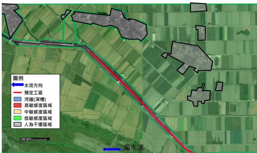
圖 4-141 濁水溪田頭堤段整建工程生態關注圖

本工程住家、農舍劃設為人為干擾區域，農地則劃設為低敏感區域，僅水尾工區部分喬木密集區域劃設為中敏感區域，施工期間應避免影響其區域，生態關注圖如圖 4-141 及圖 4-142 所示。