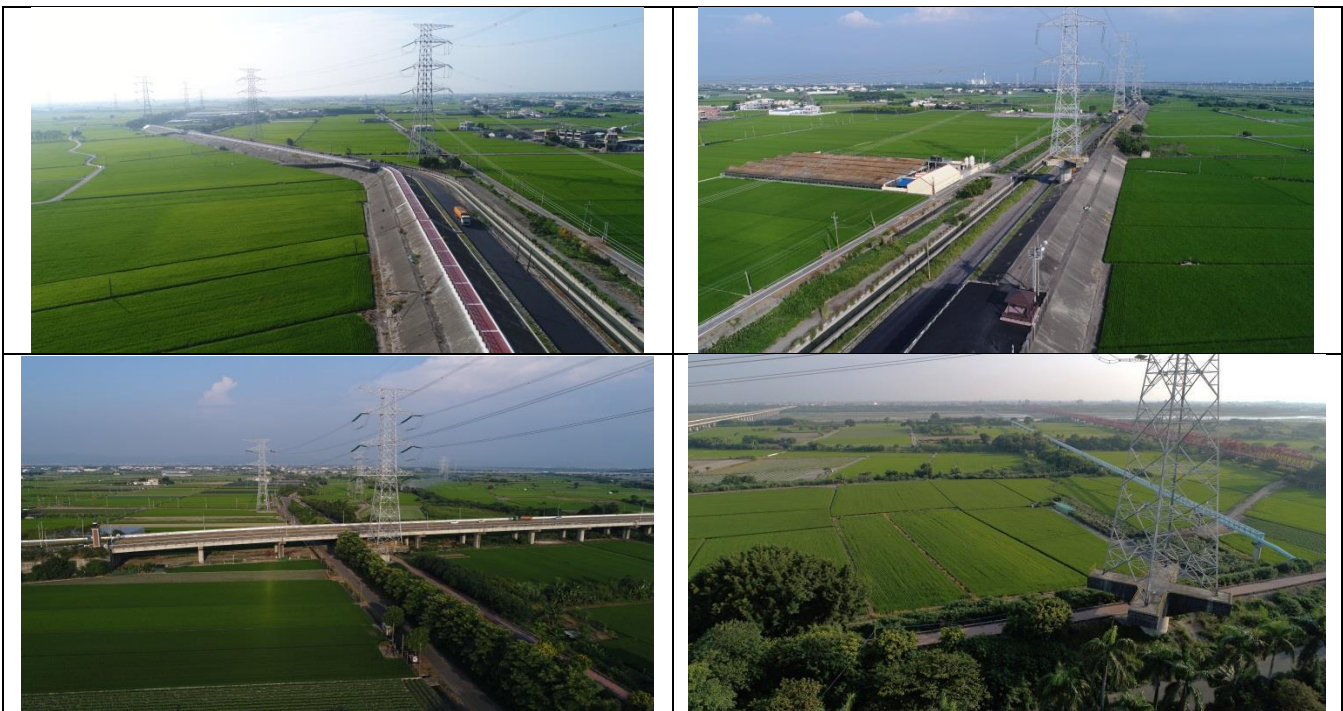
圖 4-140 濁水溪水尾及田頭堤段整建工程現況照

於 109 年 9 月 8 日勘查兩處現場，兩處土地利用雷同，大部分為農用地，且有農舍、住宅零星分布，其中田頭喬木較少，唯有堤外木棉道、榕樹人為種植喬木，水尾雖為人為種植喬木，但於堤防兩側延伸較長數目較田頭堤段多。現況如圖 4-140 所示，上半部為田頭現況照，下半部則為水尾堤段現況照。