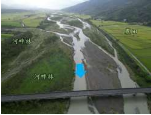
圖5 工區範圍內植被位置分佈現況。