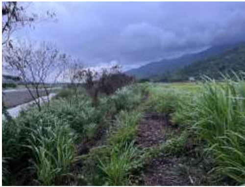
圖6 河畔林現況以高草莖禾本科植物為主。