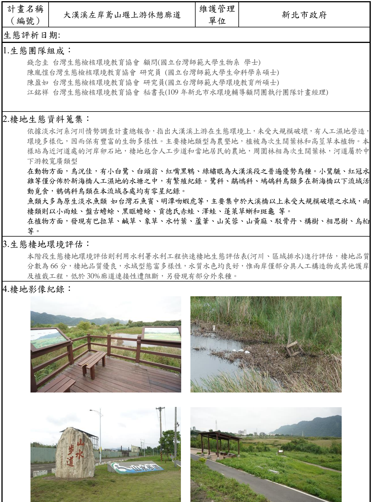
附表 M-01 工程生態評析