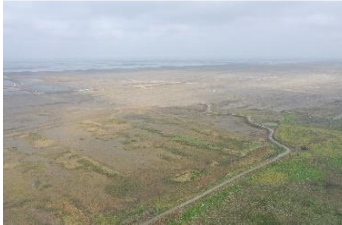
西濱下稻草蓆鋪設