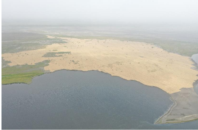
西濱下稻草蓆鋪設