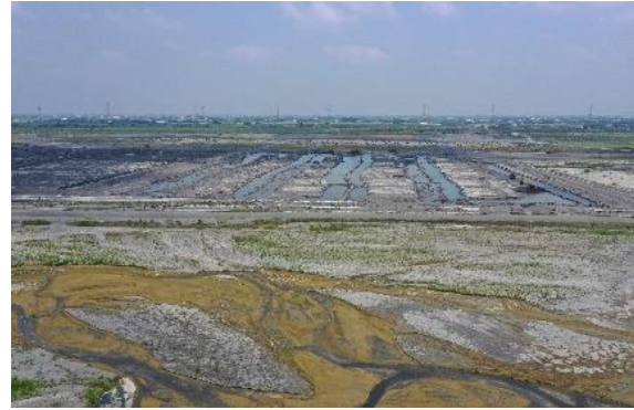
自強橋上游河道整理作業