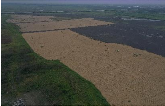
西濱橋下游稻草蓆鋪設