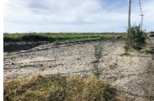
自強橋上游河道整理作業