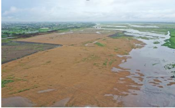
西濱橋下游稻草蓆鋪設