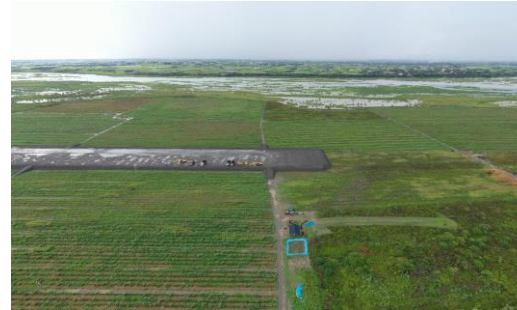
大庄堤段河道整理作業