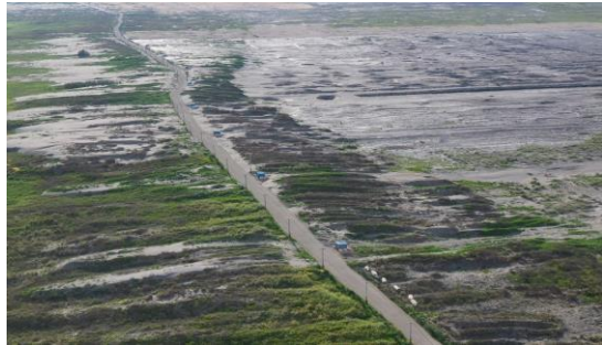
200公頃防洪林帶植栽