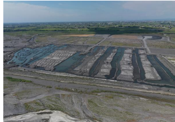
自強橋上游河道整理作業