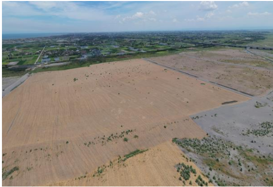
西濱橋下游稻草蓆鋪設