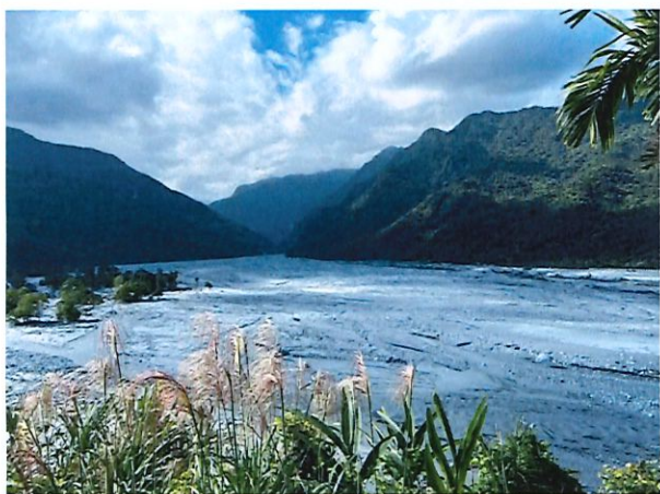
①因砂兼土石暫置區現況