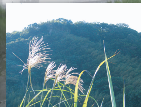
左蘆葦、右五節芒，外表極為相似