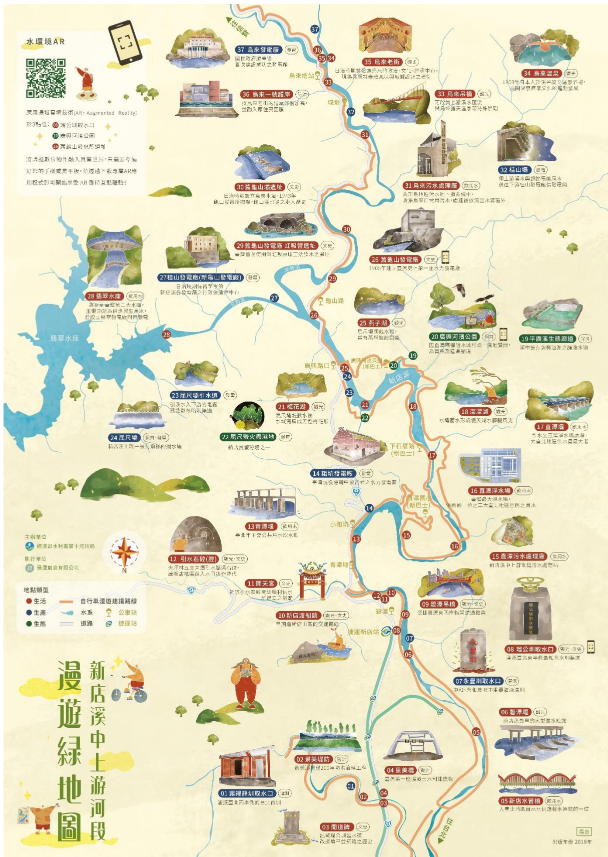
圖說: 新店溪中上游河段漫遊綠地圖

https://www.wra10.gov.tw/XindianRiverMap108.htm?