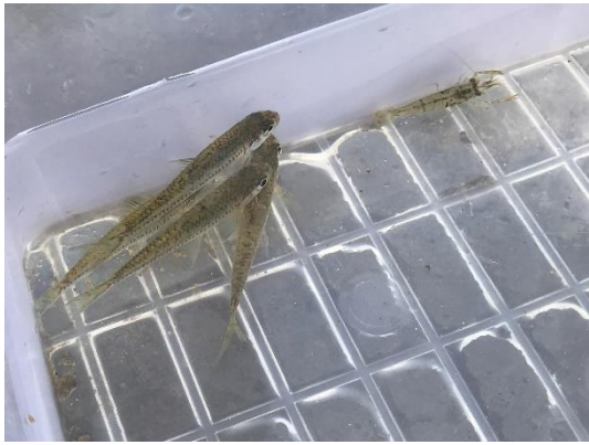
位置或樁號：236098,2701654 說明：水域生態(飯島氏銀鮎)