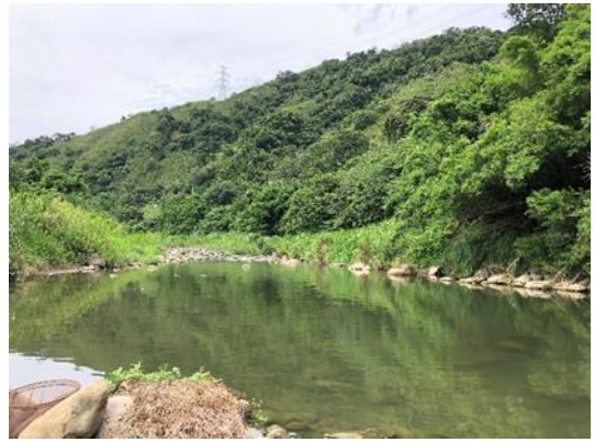
位置或樁號：236015, 2702431 說明：石虎重要棲地