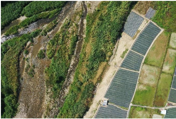
位置或樁號：234774,2718534 說明：河中島辮狀支流應迴避