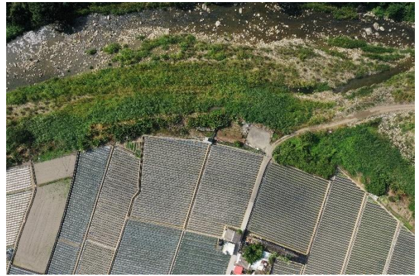
位置或樁號：236015, 2702431 說明：工區外之水體與濱溪植被應迴避