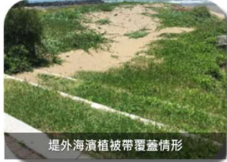
堤外海濱植被帶覆蓋情形