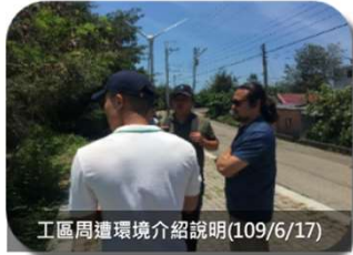
工區周遭環境介紹說明(109/6/17)