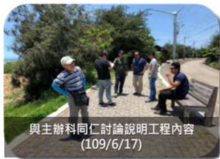
與主辦科同仁討論說明工程內容 (109/6/17)