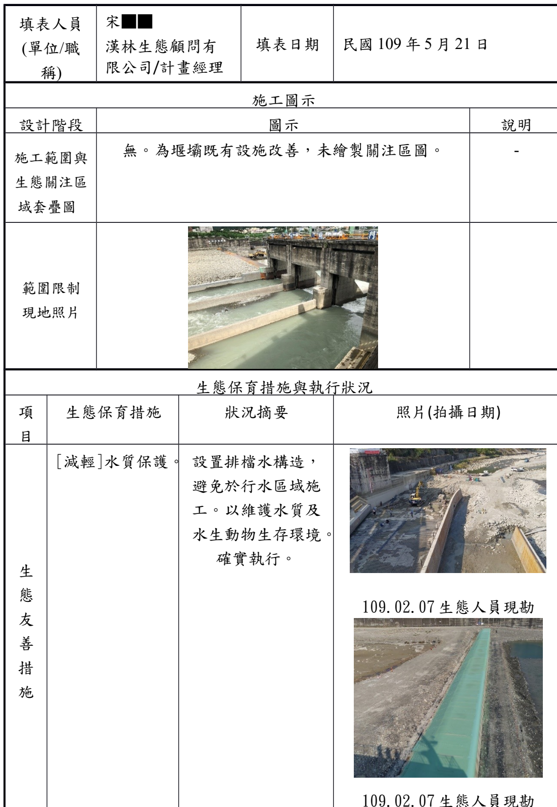
附表 C-06 生態保育措施與執行狀況