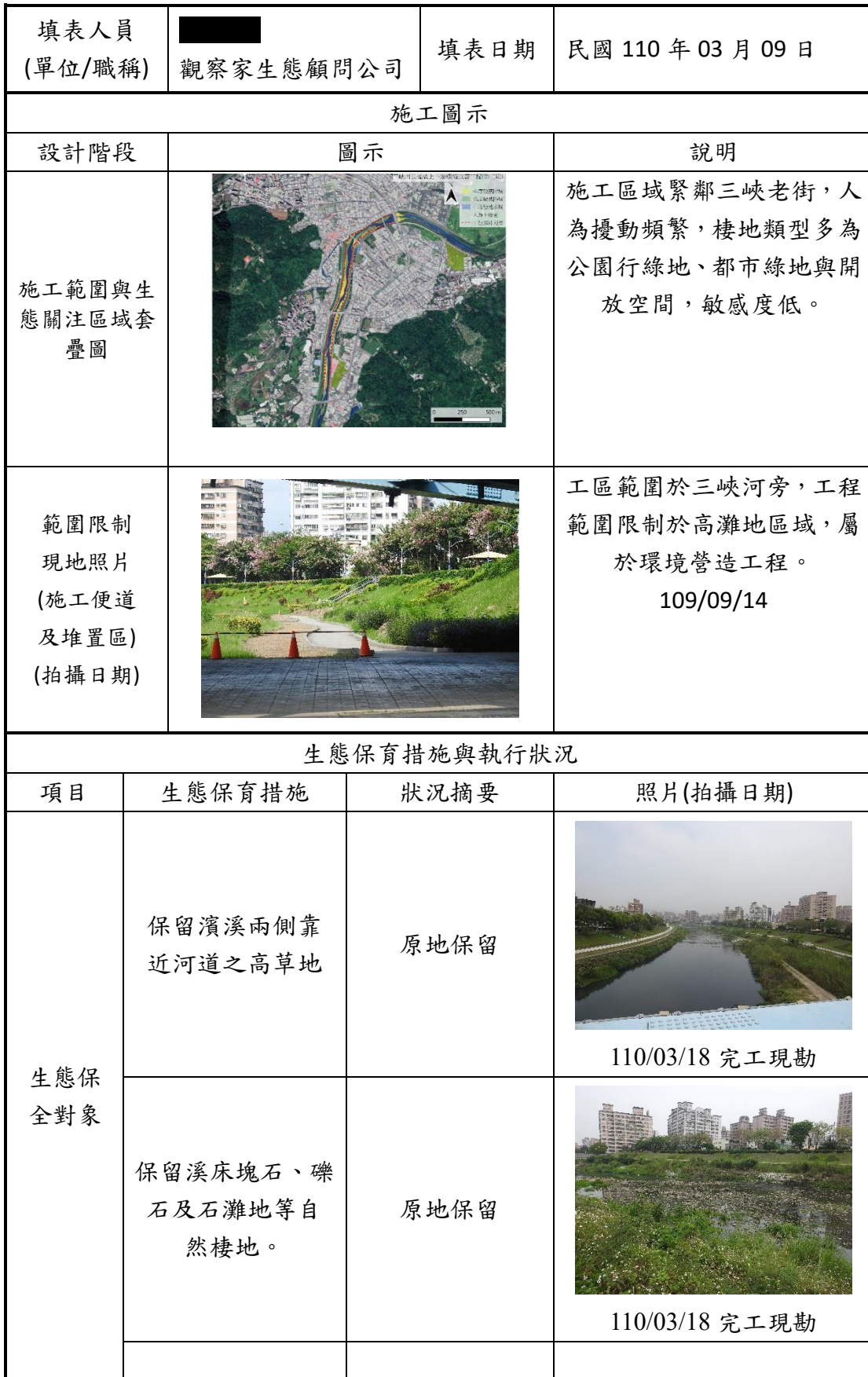
附表 C-06 施工階段生態保育措施與執行狀況