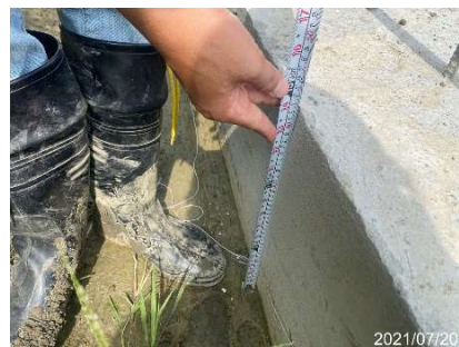
澆置完成尺寸量測