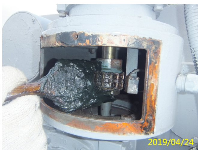
11. 108/4/24 北岸 3-3 段梯桿閘門馬達連軸器鏈條清潔潤滑