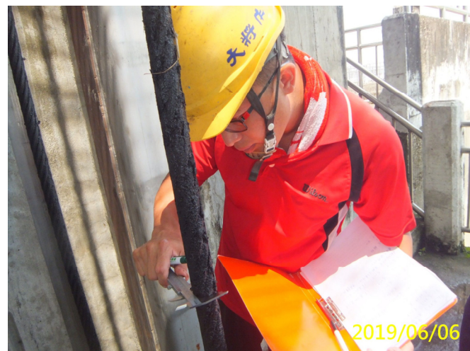
36. 108/6/6 斗六堰鋼索式閘門鋼索直徑檢查記錄