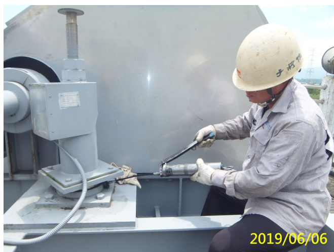
20. 108/6/6 斗六堰群組吊門機各軸承黃油更換加注潤滑