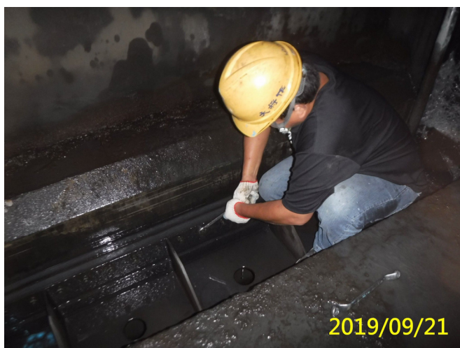
53. 108/9/21 北岸沉砂池排砂閘門頂水封螺絲檢查調整