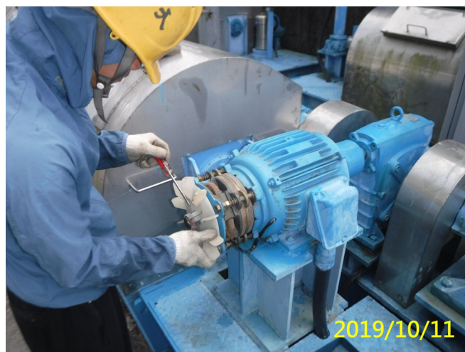
56. 108/10/11 北岸進水口吊門機馬達電磁煞車間距調整校正