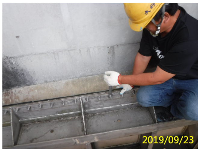
54. 108/9/23 北岸 3-3 段梯桿閘門門體各聯結固定螺栓檢查調整