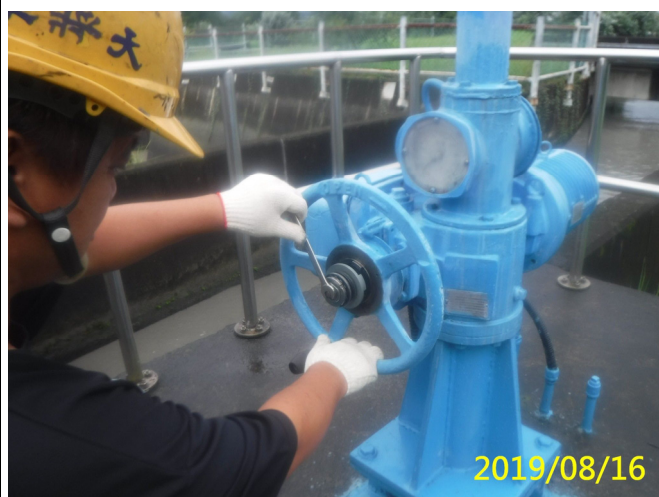
46. 108/8/16 南岸沉砂池退水路手動過扭力裝置清潔潤滑及調整