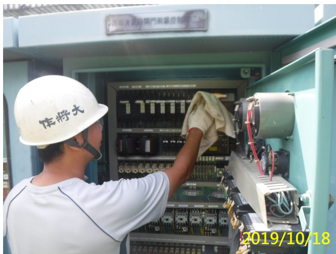
57. 108/10/18 南沉排砂閘門電氣控制盤內清潔除塵