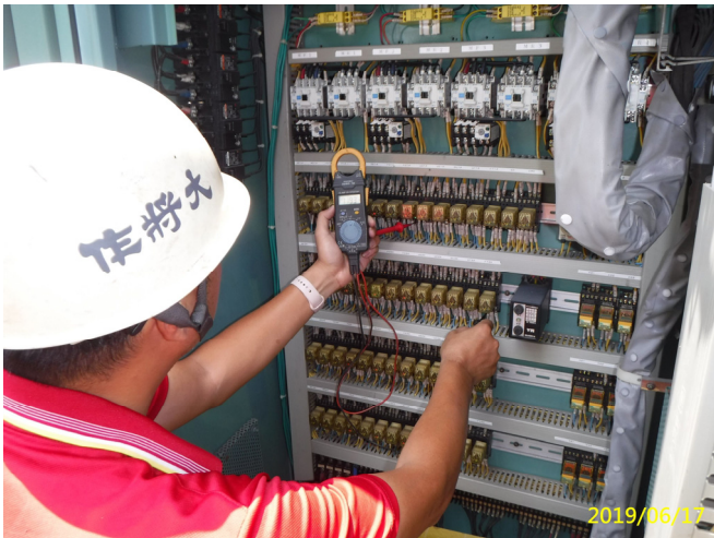
33. 108/6/17 南岸沉砂池排砂閘門電氣控制盤清潔及器具功能檢查