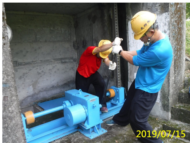
38. 108/7/15 番子寮水岸手動梯桿閘門環境清潔及閘門試運轉