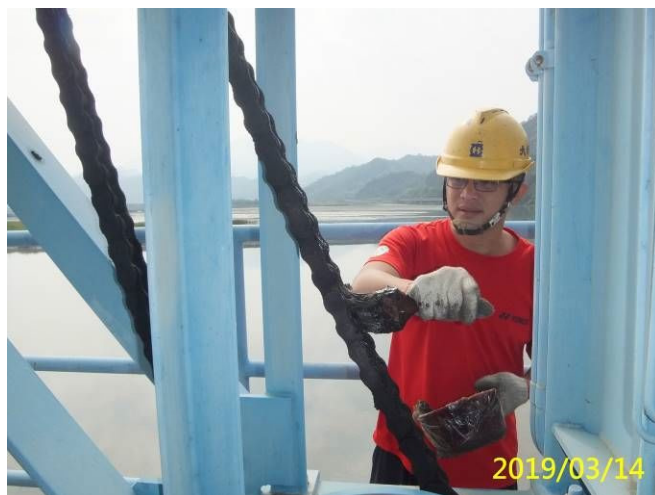
8. 108/3/14 北岸進水口耙污機檢查保養