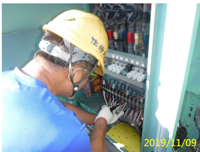
59. 108/11/09 溢洪道區域分電盤端子台接點螺絲鎖緊