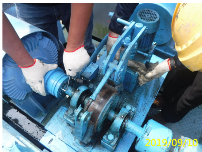
50. 108/9/10 溢洪道機械式過扭力裝置扭力值設定檢查調整