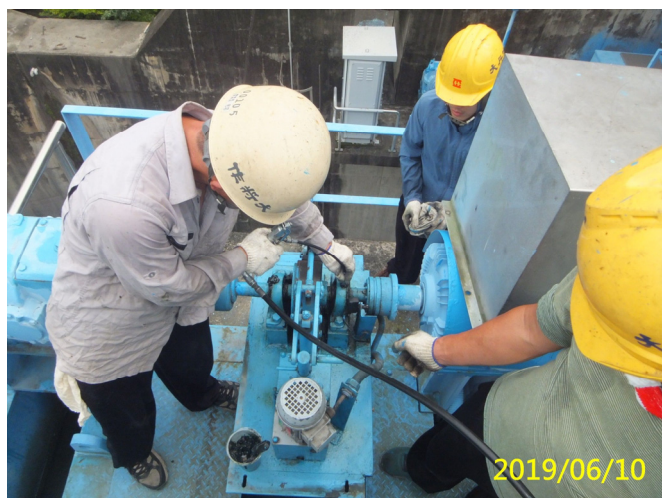
21. 108/6/10 溢洪道吊門機各軸承黃油加注潤滑