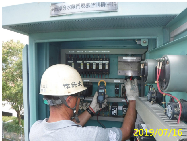
39. 108/7/16 南岸沉砂池分水閘門現場控制盤清潔除塵及功能檢測