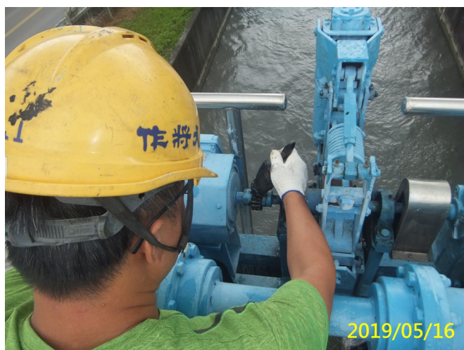
17. 108/5/16 南岸沉砂池分水閘門聯軸器鏈條清潔潤滑