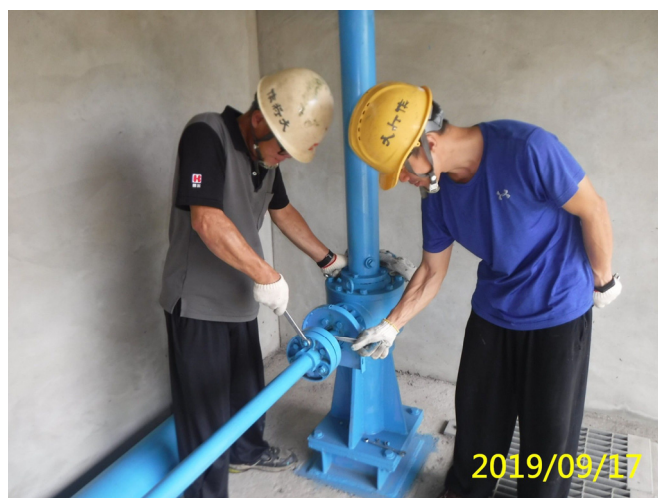
52. 108/9/17 南岸沉砂池排砂閘門吊門機傳動軸連軸器檢視鎖緊