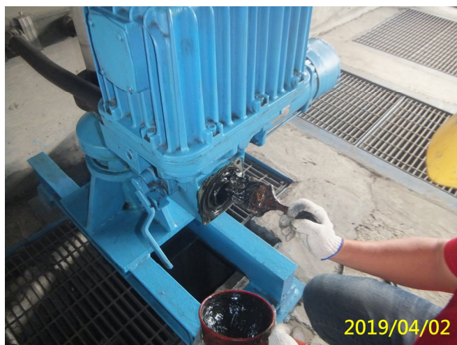
10. 108/4/2 魚道閘門手動升降裝置軸承清潔潤滑