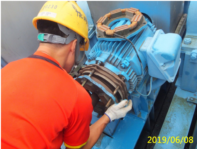
31. 108/6/8 溢洪道吊門機馬達電磁煞車清潔及調整校正