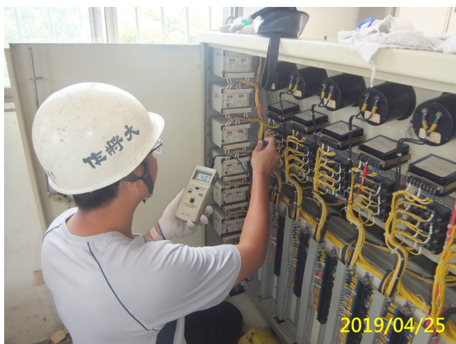
23. 108/4/25 北岸 4-3 段閘門室內操作桌電氣設備檢查