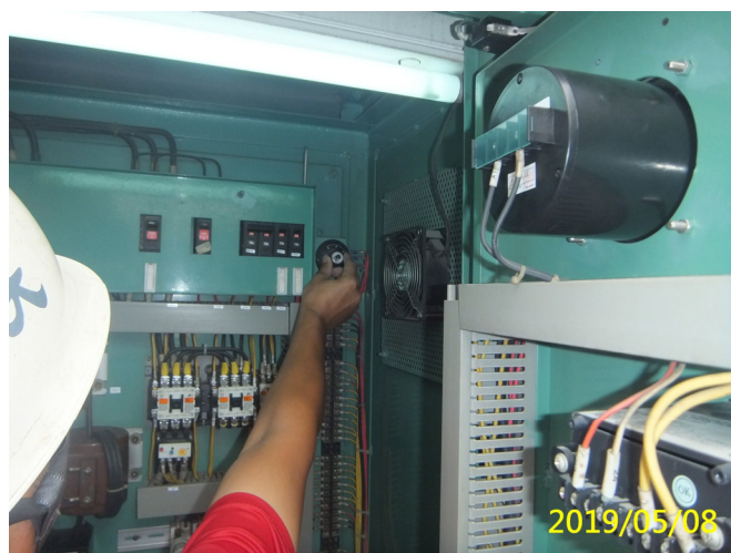
25. 108/5/2 魚道閘門吊門機驅動控制裝置定位極限開關功能檢測檢查