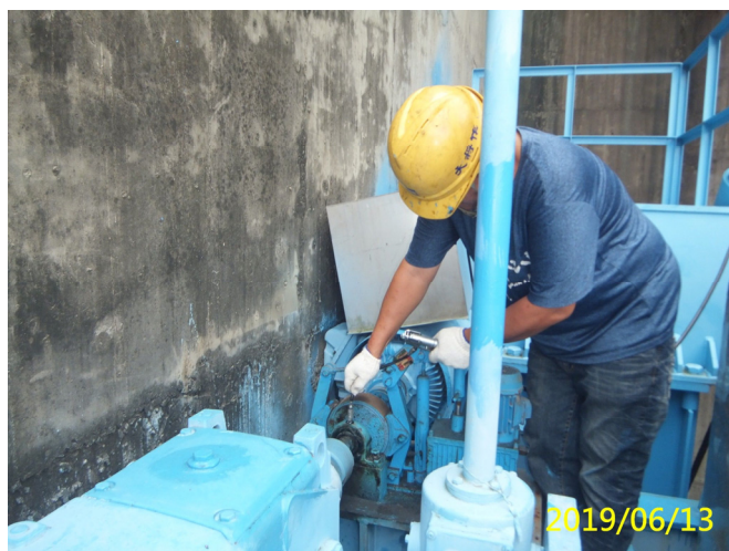
22. 108/6/13 排砂道吊門機各軸承黃油更換加注潤滑