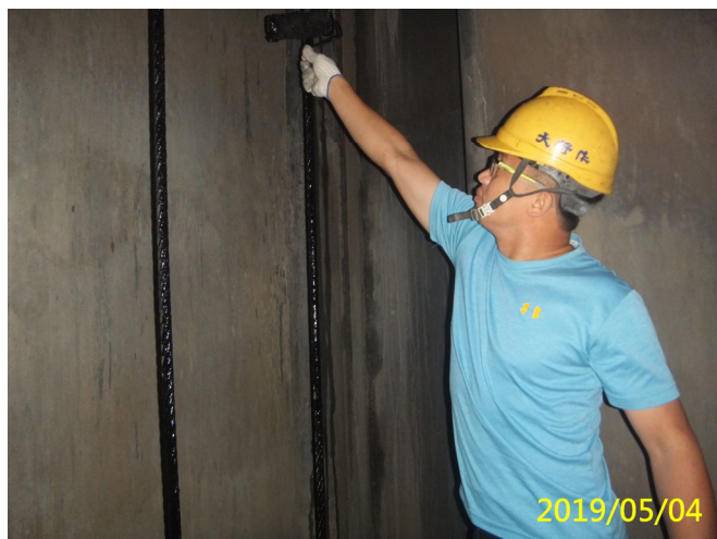
13. 108/5/4 南岸進水口閘門吊門機鋼索塗抹齒索油