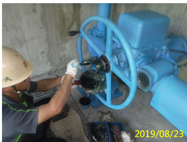
34. 108/8/23 北岸沉砂池排砂閘門手動過扭力 裝置清潔潤滑