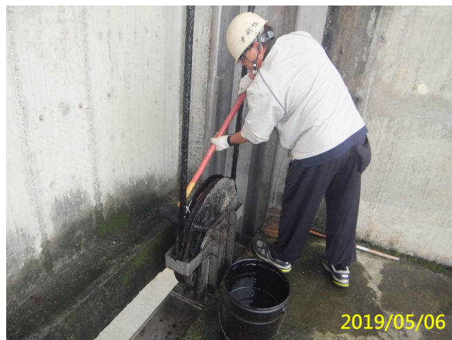
14. 108/5/6 斗六堰鋼索式閘門鋼索及滑輪齒索油塗抹作業