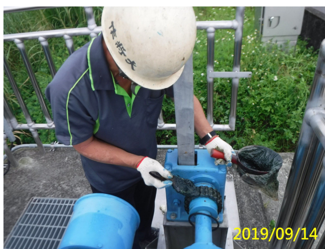
36. 108/9/14 十二甲手動梯桿閘門連軸器鏈 條清潔潤滑