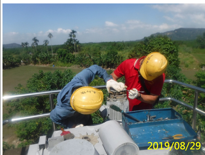
48. 108/8/29 南四段梯桿閘門吊門機馬達電磁煞車檢查調整