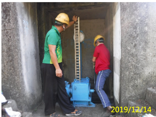
63. 108/12/14 番子寮手動梯桿閘門自重下降及手動試運轉測試