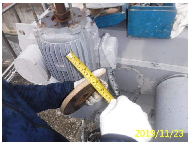
62. 108/11/23 北岸 3-3 段梯桿吊門機馬達電磁煞車來令片厚度檢測