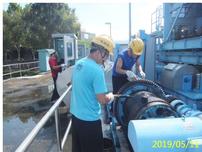
16. 108/5/11 北岸進水口吊門機鋼索及鼓輪齒索油塗抹保養