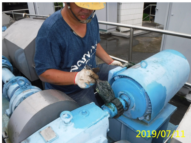
30. 108/7/11 北岸進水口吊門機馬達傳動鏈條清潔及潤滑