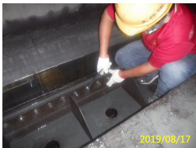
47. 108/8/17 南岸沉砂池排砂閘門頂水封螺栓檢查調整