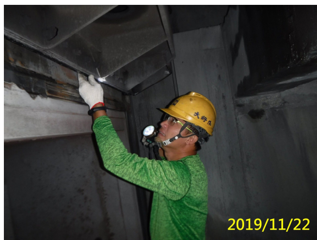
58. 108/11/22 北岸沉砂池排砂閘門利用停水檢查底水封磨損情形