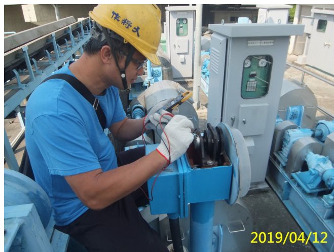
20. 108/4/12 北岸進水口閘門開度用可變電阻器功能檢測