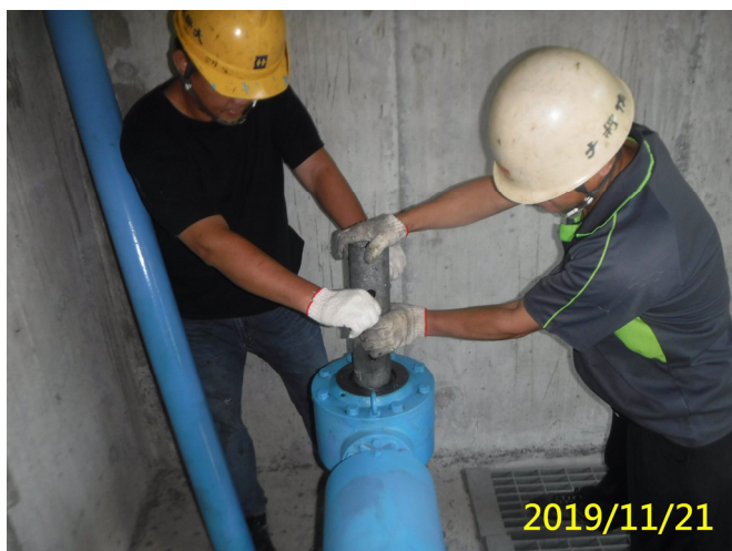
61. 108/11/21 北岸沉砂池排砂閘門吊門機螺桿銅套檢查及固定鎖緊