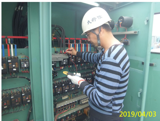
19. 108/4/3 南岸進水口區域及現場操作盤清潔及器具功能檢查