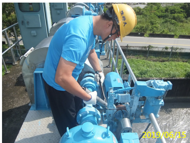
24. 108/6/15 南岸沉砂池分水閘門吊門機各軸承黃油更換加注潤滑