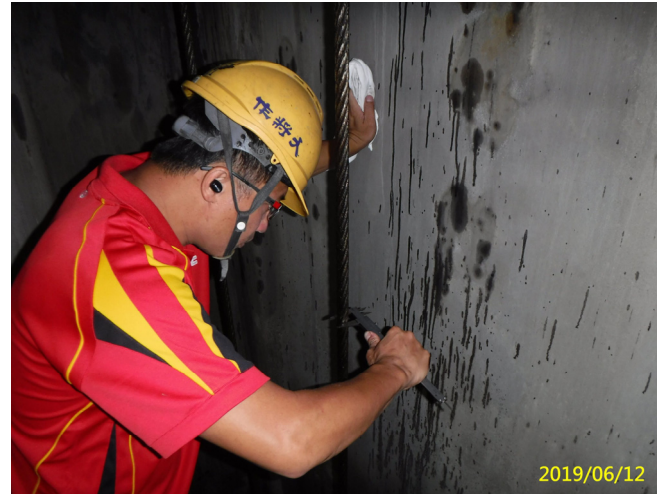
32. 108/6/12 北岸進水口吊門機鋼索檢查及鋼索直徑值記錄