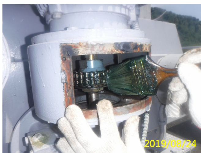
35. 108/8/24 北岸 3-3 段梯桿閘門馬達連軸 器鏈條清潔潤滑