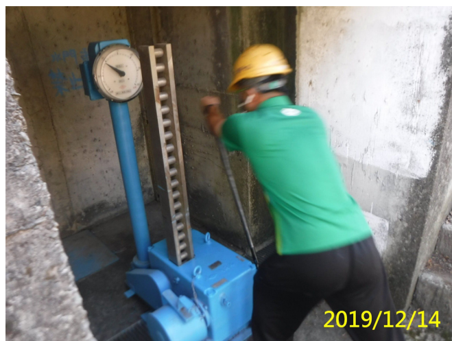
64. 108/12/14 番子寮手動梯桿閘門自重下降及手動試運轉測試