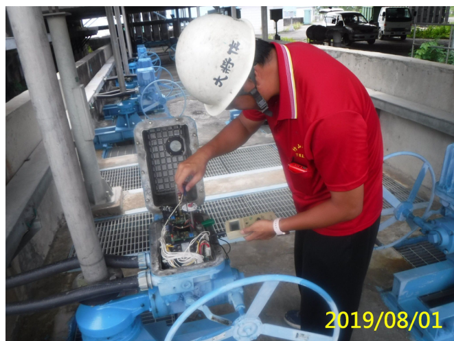
43. 108/8/1 魚道吊門機開度信號電流值校正