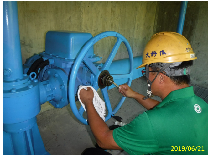
34. 108/6/21 北岸沉砂池排砂閘門手動運轉過扭力裝置清潔及校正