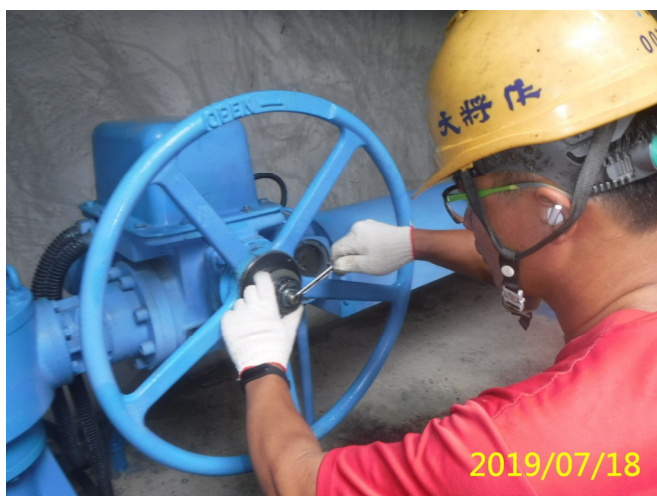
41. 108/7/18 南岸沉砂池排砂閘門手動操作過扭力裝置清潔及校正