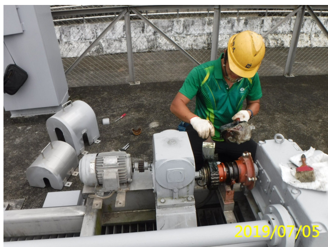
28. 108/7/5 斗六堰進水口吊門機手自動離合器清潔潤滑