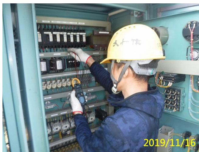
60. 108/11/16 南岸沉砂池排砂閘門電氣控制盤器具功能檢測