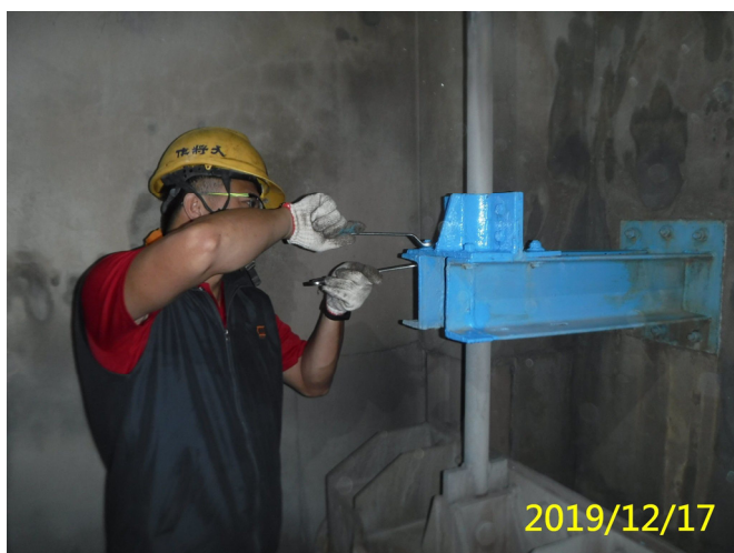
65. 108/12/17 南岸沉砂池排砂閘門水封螺絲調整