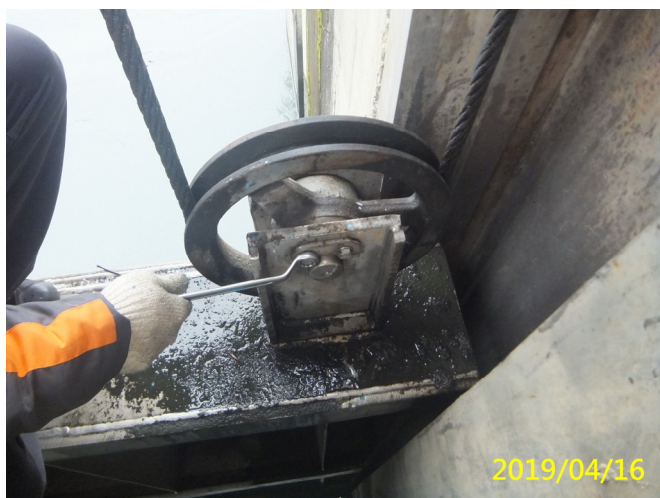
21. 108/4/16 南岸沉砂池分水閘門門體滑輪固定鍵板螺絲鎖緊