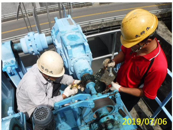
29. 108/7/6 溢洪道吊門機減速機聯軸器清潔及潤滑