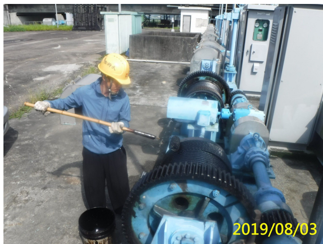
32. 108/8/3 南岸進水口吊門機鋼索及鋼索輪 進行齒索油塗抹作業