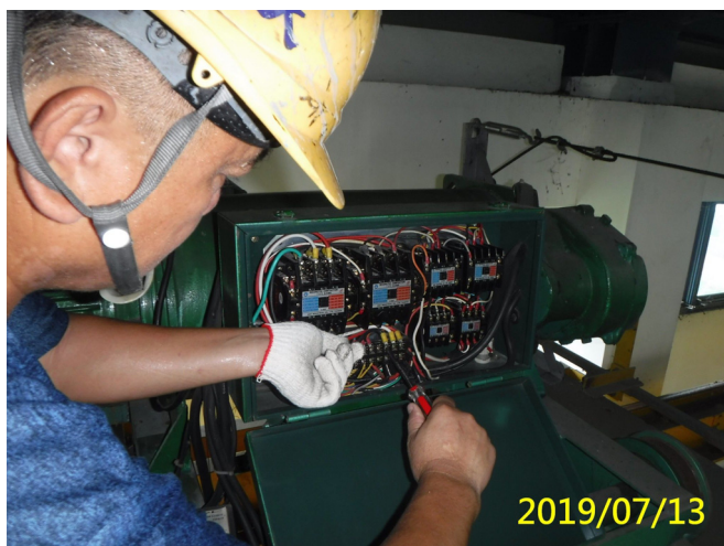
37. 108/7/13 魚道閘門控制箱電氣設備檢查