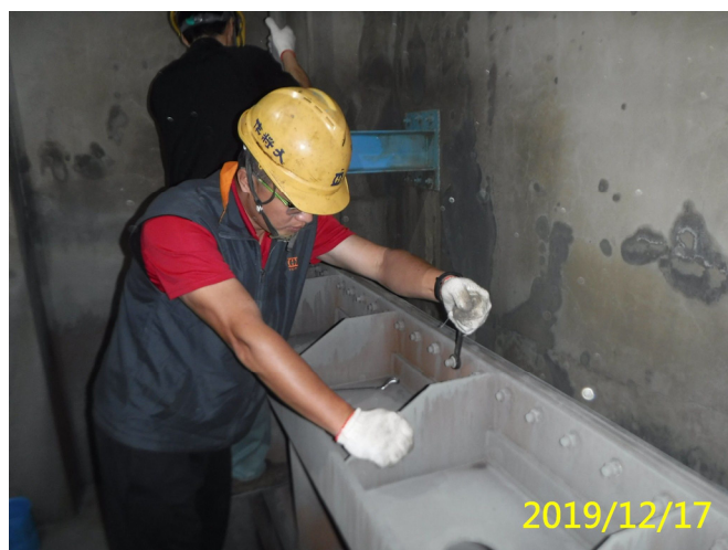
66. 108/12/17 南岸沉砂池排砂閘門水封螺絲調整