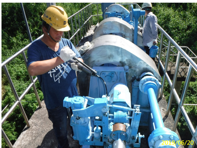
25. 108/6/20 北岸沉砂池分水閘門吊門機各軸承黃油更換加注潤滑