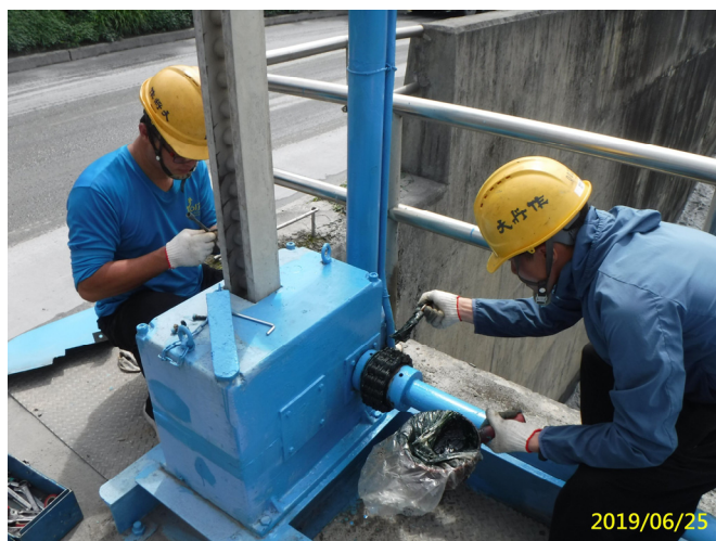
26. 108/6/25 南一段梯桿閘門聯軸器鏈條及開度傳動鏈條潤滑