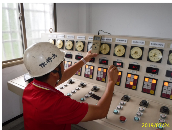
42. 108/7/24 北岸3-3段室內操作桌數位開度計校正設定