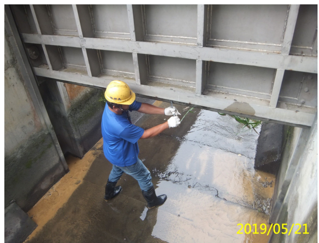
29. 108/5/17 南岸沉砂池排砂閘門吊門機銅套固定環鎖緊固定