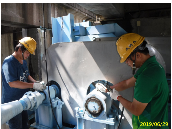
27. 108/6/29 兩米調節閘門吊門機各軸承黃油更換加注潤滑