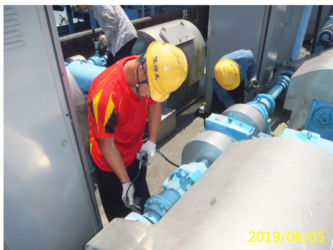
19. 108/6/5 南岸進水口閘門吊門機各軸承黃油加注潤滑