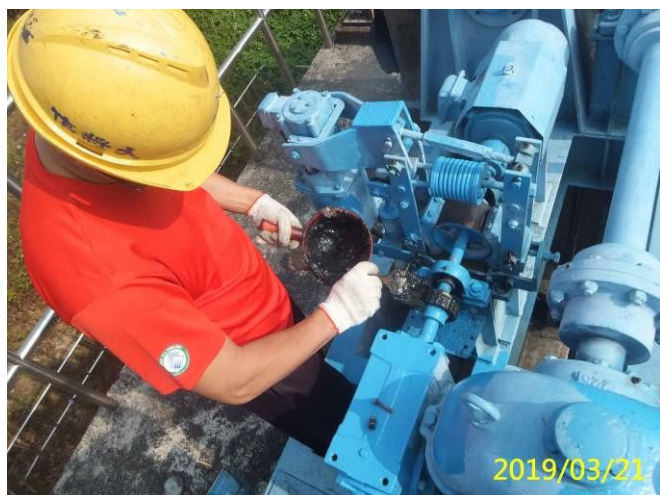
9. 108/3/21 北岸沉砂池分水閘門連軸器鏈條清潔及潤滑