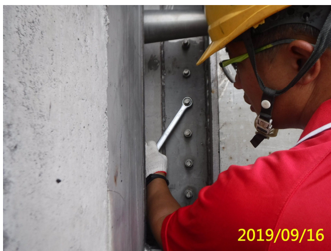
51. 108/9/16 南岸沉砂池分水閘門門體水封螺絲檢查調整