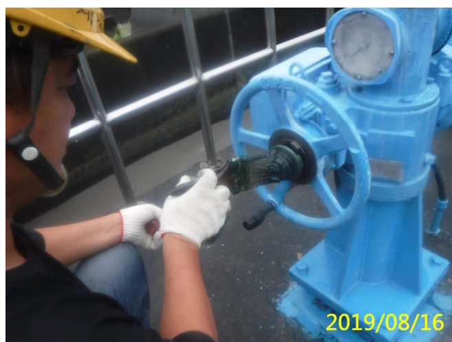
33. 108/8/16 南岸沉砂池退水路手動過扭力 裝置清潔潤滑