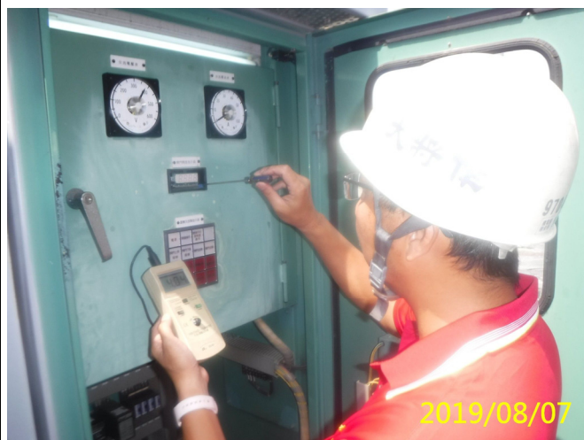
44. 108/8/7 溢洪道閘門現場控制盤清潔及器具功能檢測動作測試