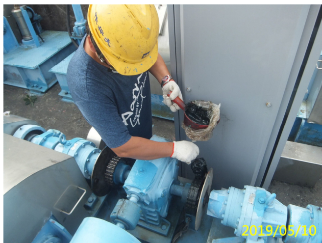
15. 108/5/10 北岸進水口吊門機連軸器鏈條清潔潤滑