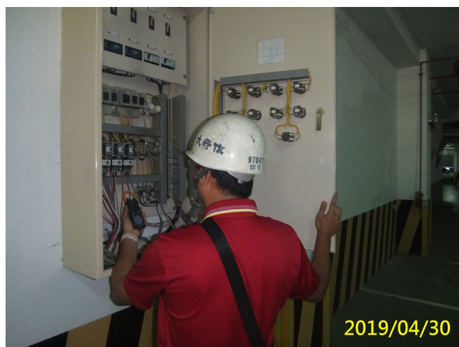
24. 108/4/30 集管大樓停車場污水及廢水泵試運轉及檢查運轉電流