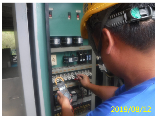
45. 108/8/12 北岸緊急閘門現場控制盤器具功能檢測