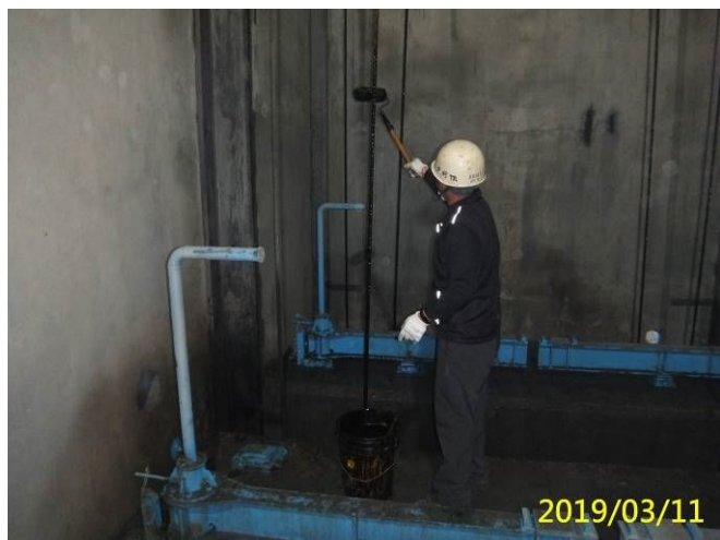
7. 108/3/11 北岸進水口閘門吊門機鋼索及鋼索輪塗抹齒索油