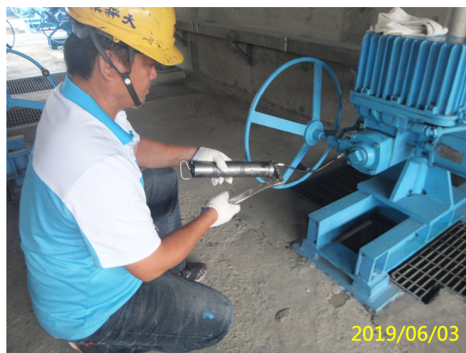
18. 108/6/3 魚道閘門吊門機各軸承黃油加注潤滑