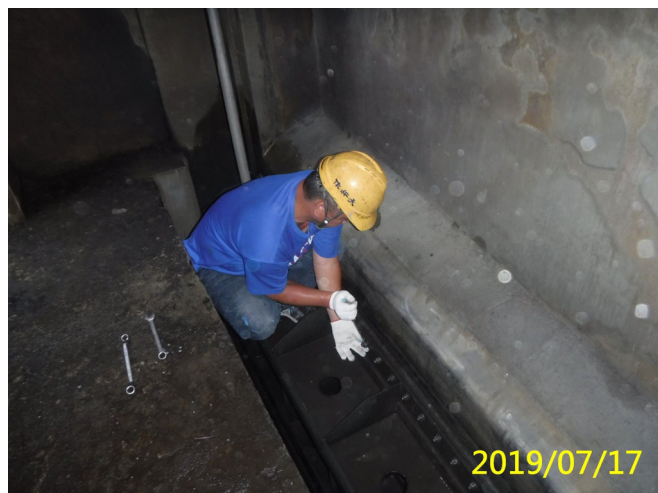
40. 108/7/17 岸沉砂池排砂閘門頂水封螺栓檢查調整