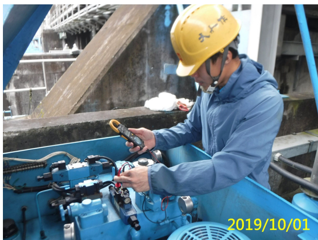
55. 108/10/1 魚道排砂道吊門機油壓控制電磁閥功能檢測