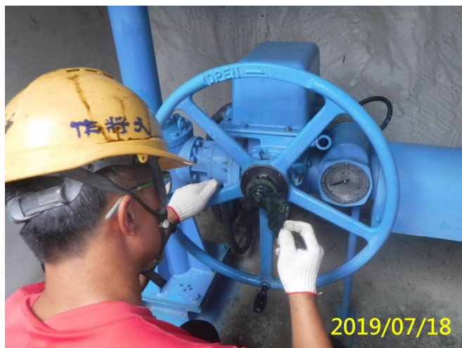
31. 108/7/18 南岸沉砂池排砂閘門手動操作 過扭力裝置清潔潤滑