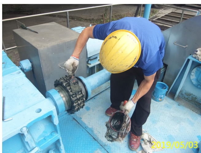
12. 108/5/3 南岸進水口緊急閘門連軸器鏈條清潔及潤滑