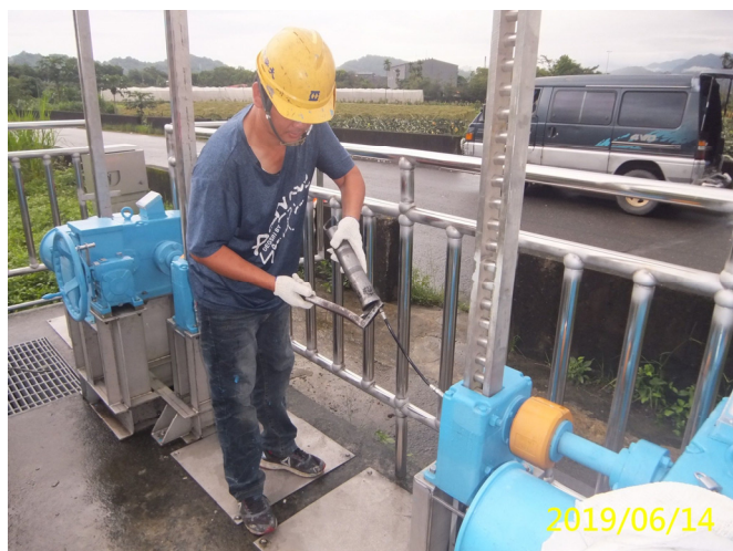
23. 108/6/14 十二甲自動及手動閘門各軸承黃油更換加注潤滑