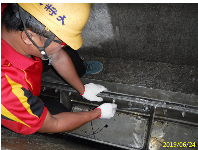
35. 108/6/24 北岸4-3段吊門機閘門門體各螺栓檢查調整