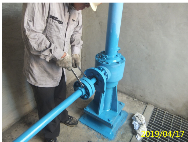
22. 108/4/17 南岸沉砂池排砂閘門傳動軸聯軸器固定螺絲檢查鎖緊