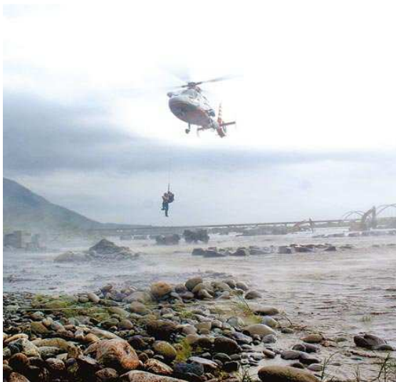
勞工受困於河床搶救情形

以下附摘錄新聞圖片(中時電子報 101.05.4 及蘋果日報 101.4.28) 供各事業單位參考，請做好防護措施，避免災害發生。