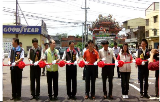
4-排水與道路共構完成－白局長與地方共同剪採通車典禮。