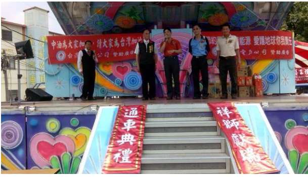
3-排水與道路共構完成－地方人士舉辦慶祝通車典禮。